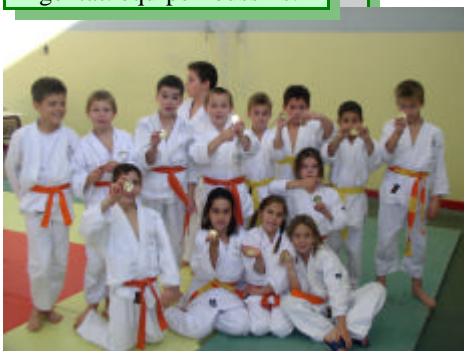
Argentat: équipe Poussins.