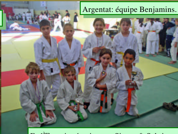
Argentat: équipe Benjamins.