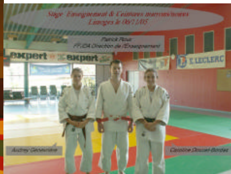
Stage Jujitsu Malemort