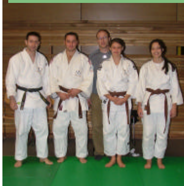
Argentat: équipe Mini-poussins.